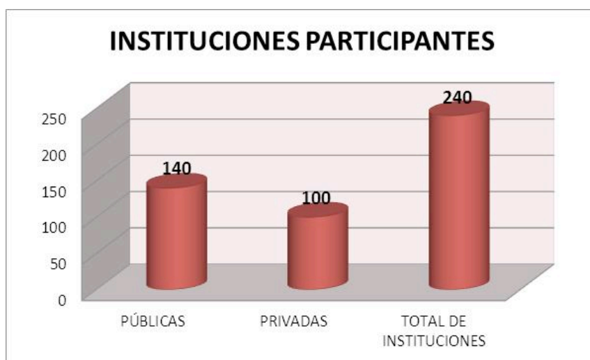
Gráfico III Tipo de IES participantes en el proceso (2003-2010)

Fuente: Secretaría Técnica de la Coordinación Nacional de Certificación Académica de ANFECA.