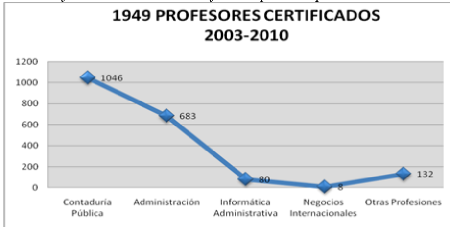
Gráfico I Académicos Certificados por disciplina 2003-2010

Fuente: Secretaría Técnica de la Coordinación Nacional de Certificación Académica de ANFECA.